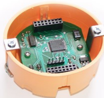
Gipszkarton falba szerelhető 60-as doboz (tartozék)