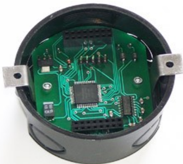
Normál falon belüli 60-as doboz (tartozék)